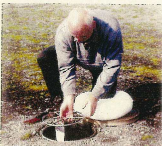
3. Unter leichtem Drehen am Griffrad wird die Zähleranlage wieder abgesenkt.