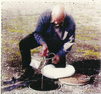
1. Nach Entfernen von Deckel und Isolierschluss wird die Zähleranlage unter leichtem Drehen herausgezogen.

Schachteigenschaften und Abmessungen wie beim zuvor beschriebenen Schacht Qn 2,5, jedoch für den Einbau von waagerechten oder Steigrohr-Wasserzählern Qn 6, Anschlussmuffen am Ein- und Ausgang mit Gewinde nach DIN EN 10226-1 sowie mit der bewährten EWE-O-Ring-Technik versehen, Gewindegröße Rp 1 1/4". Die entsprechenden Ausführungen der Wasserzähler-Anlagen finden Sie auf den folgenden Seiten.