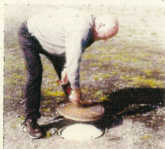
4. Nicht vergessen, das Isolierkissen einzulegen, bevor der Deckel geschlossen wird.