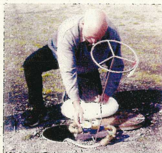
2. Durch den flexiblen Schlauch kann die Zähleranlage bequem neben der Schachöffnung abgelegt und abgelesen oder der Zähler ausgewechselt werden.